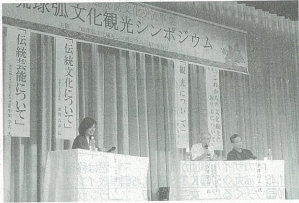
各パネリストが提言を述べた「これからの文化観光のあり方について」

イベントは「奄美群 琉球文化圏にある奄美 認と、鹿児島県本土を」いる。この日は会場に島復帰60周年記念事 が、世界文化遺産登録 含め、今後の経済文化 用意した300席は満 業の一環。沖縄と同じ) に向けた協力体制の確 の交流発展を自指して 席。立ち見も出るほど