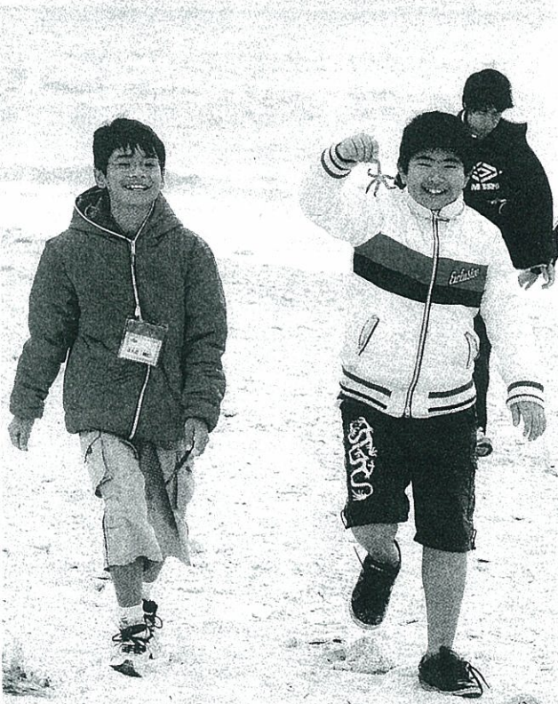
伊江島の自然も満喫しました。ビーチで遊ぶ児童。12月27日、伊江村青少年旅行村