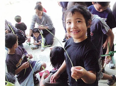
離島活性化専門家派遣事業の様

体験や交流は双方向。相互に喜びが生まれ、互いに気づきがあります。沖縄の各地で、修学旅行に訪れた子どもたちの目が輝きだし、不登校の子や生きる勇気を失っていた子が元気になったという声が届いているのですから、すごいことですよ。