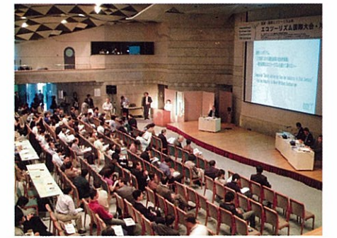
事務局として企画・運営に携わった「エコツーリズム国際大会・沖縄」の様

県内各地、全国にまたがるプレーン集団がわが社の財産です。でも、主役は沖縄、そして地元の人。プロの知恵を借りながら、自らの手で商品やシステムをつくることで、地域が自立できるように、私たち「なんでもお助け隊™」は、いつでもどこでも出動します。