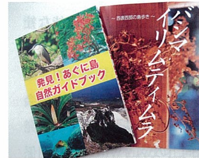
粟国島および西表島のガイドブック

素晴らしい自然や文化でも、地元で毎日目に見ていると、その良さに気づかないものです。外の目、専門家の目を入れることで、価値を確認できますよね。