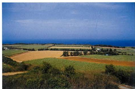
環礁が隆起してできた島。外周は約13キロの小さな島だが、絶滅危惧種や希少種植物が多く自生している

文=権聖美 Text:Kiyomi Gon http://sungmi.ti-da.net