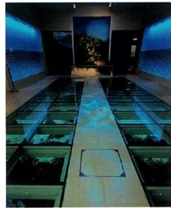
サンゴ礁が足下に広がる博物館・常設展へのアプローチ