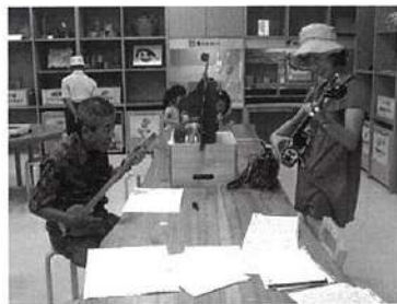
沖縄の先人の知恵や自然の仕組みを遊びながら学ぶ「ふれあい体験室」