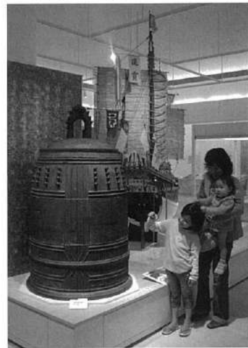
中継貿易で栄えた琉球王国の繁栄の象徴と言われる「万国津梁（ばんこくしんりょう）の鐘」。万国津梁とは、世界を結び架け橋の意味

一方、すべての事業が独立採算でまかなえるわけではありません。たとえば、学芸員の調査研究はいわば医学における基礎医学にあたる分野で、最初から短期的な成果は見込めません。ですから、そこは行政が負担し、学芸部門については県が責任をもちます。展示については指定管理者制度にもとづき、年間の企画6本のうち4本を指定管理者に委託しています。ただし、指定管理者に任せただけで終わりでなく、行政としての役割をきちんと果たしていきたいと思えます。