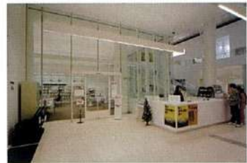
総合案内と情報センター