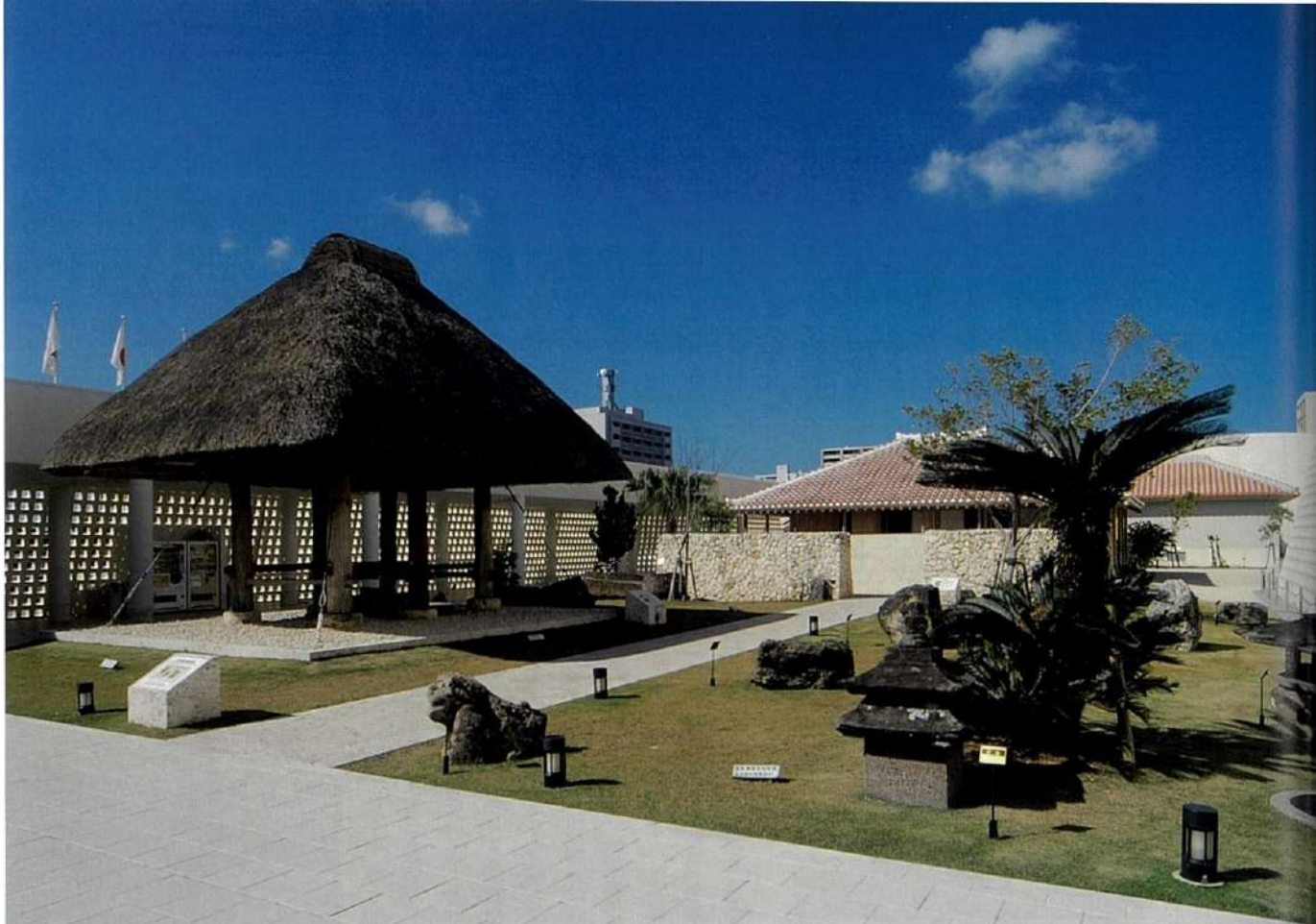
博物館・屋外展示場に再現された伝統的な高倉と民家

することが重要で、それは135万の沖縄県民の総意と熱意でつくった「沖縄振興開発計画」に表れています。この計画には、これからの沖縄を教育的、福祉的、文化的にどのようなようにしていくのかというビジョンが示されていますから、それにいかに対応するかがわれわれの課題だと考えています。