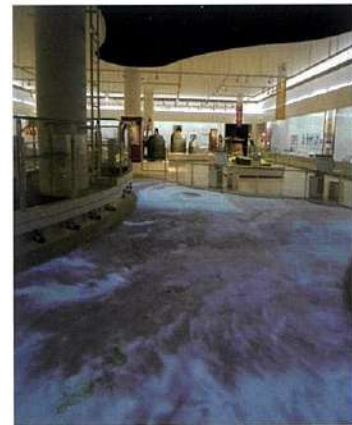
博物館・総合展示の大型ジオラマ。人工衛星からの画像で琉球列島を観察することができる